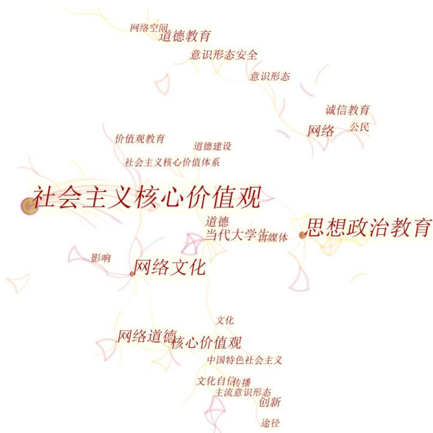
图 1. 中文关键词知识图谱